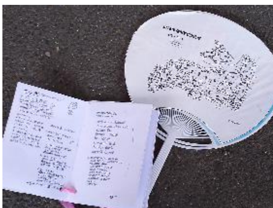
配布された作業所の方々が作成してくれた うちわと歌集