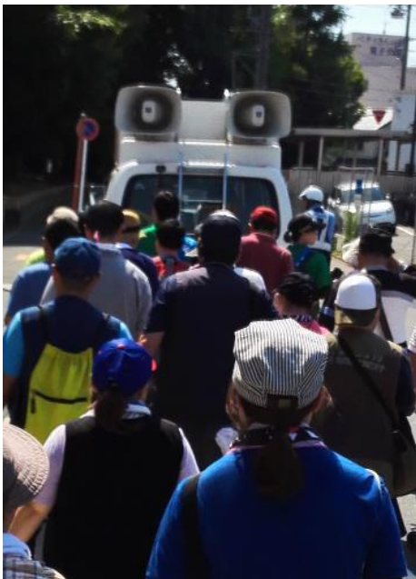
先導車を先頭に行進