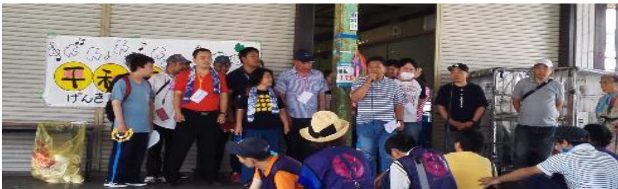
生協の中川センターで昼食と参加団体の自己紹介