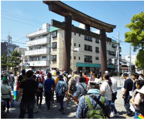
中村公園(豊国神社の鳥居)出発